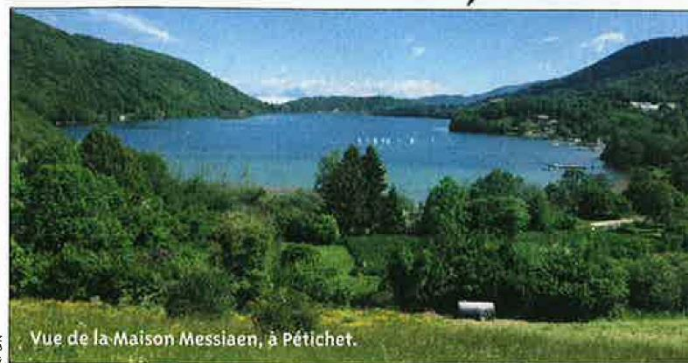
Vue de la Maison Messiaen, à Pétichet.